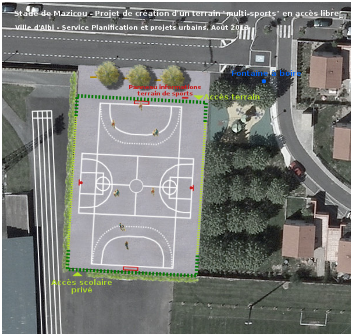
Plan d'aménagement au stade de l'esquisse