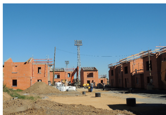
Le chantier en cours