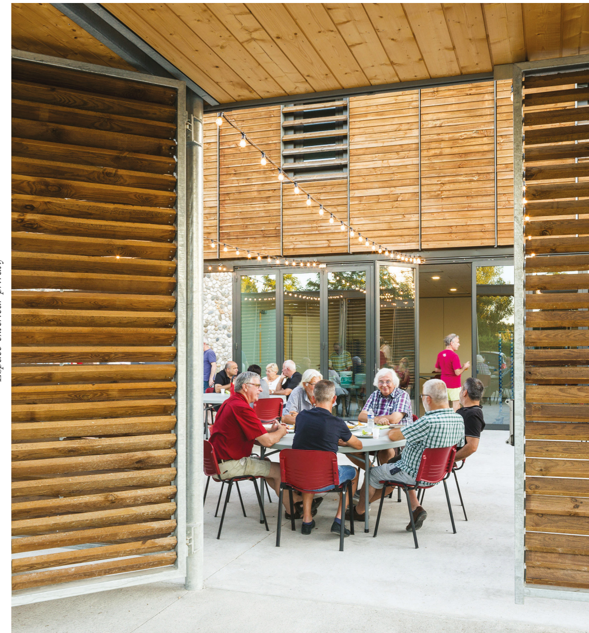
Espace extérieur privatif