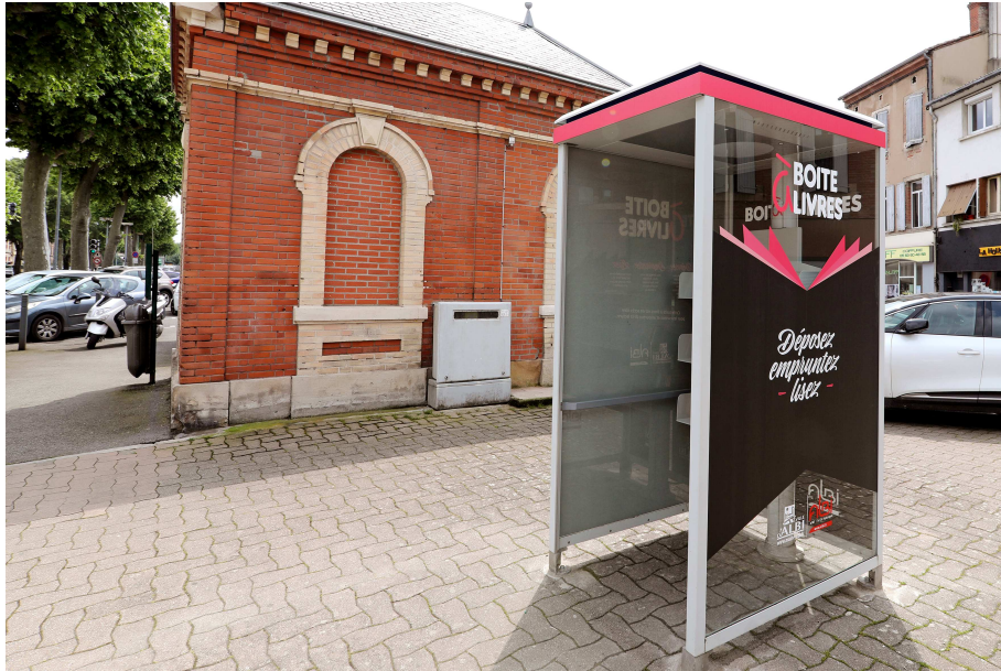
Installation d'une boîte à livres boulevard de Strasbourg en 2018