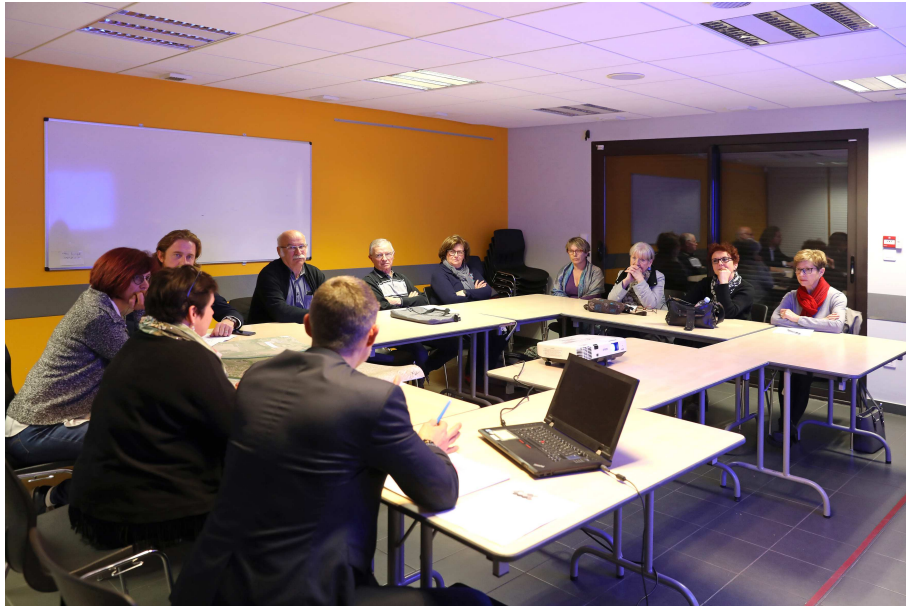
Atelier de travail du conseil de quartier

En effet, depuis 10 de travail de concertation et de co-construction, plusieurs projets concrets ont vu le jour dans le quartier dont notamment :