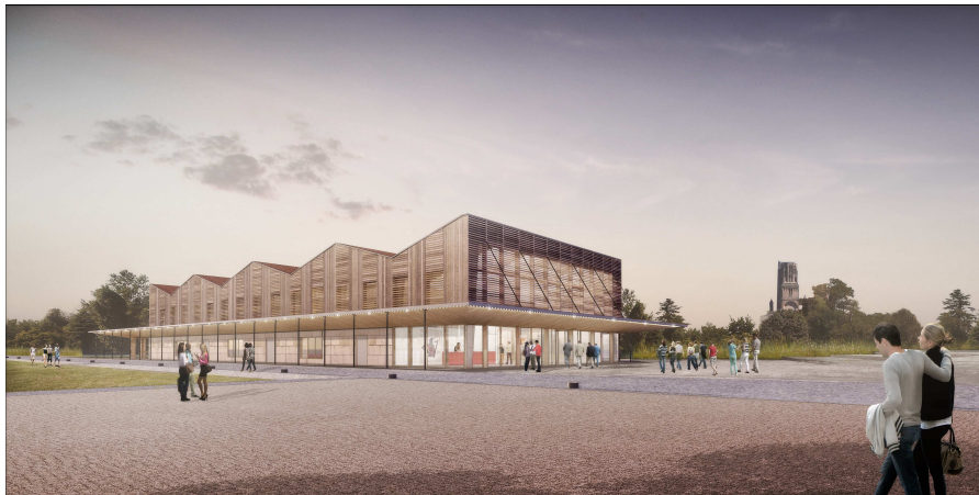
Le nouvelle salle en projet

Cette nouvelle salle est conçue pour être fonctionnelle avec un temps de montage / démontage réduit et des conditions acoustiques optimales.