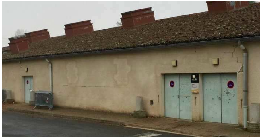
La salle des fêtes actuelle

Les stationnements, initialement regroupés, seront répartis en deux parkings intégrés, un premier à l'entrée Nord et un deuxième à proximité de la future salle avec une station de vélo.