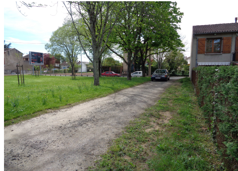
Chemin à aménager