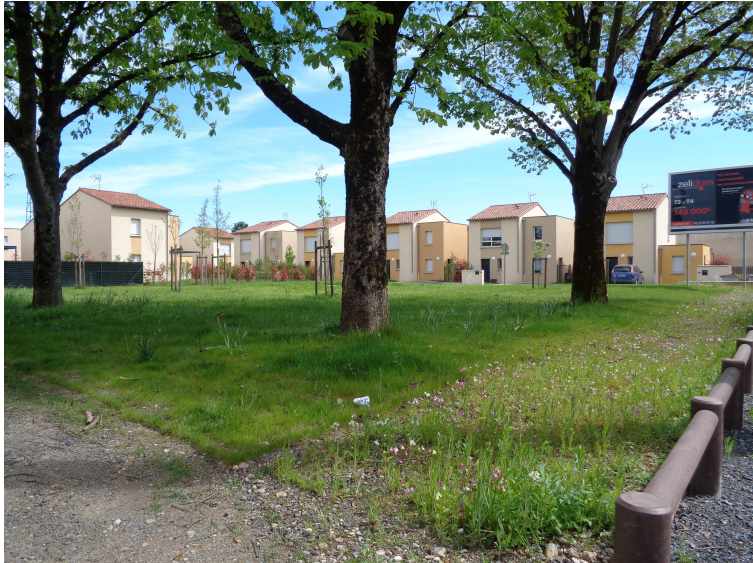
Vue du square depuis l'avenue de Pélissier