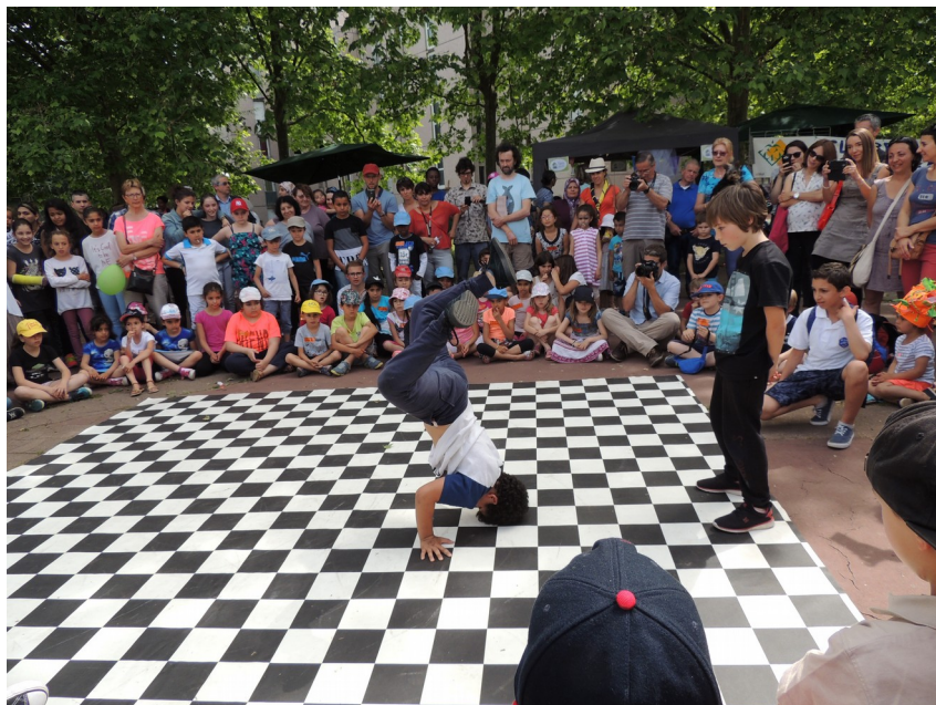
L'édition 2017 du Printemps des Cultures – Un temps fort incontournable de la vie du quartier

Veyrières-Rayssac, Cantepau et Lapanouse-St Martin.