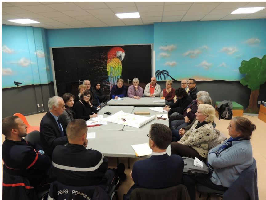
Un échange constructif entre conseillers et représentants des forces de sécurité et de secours

In fine, ces actions doivent contribuer, par une mise en contact directe, à faire évoluer les perceptions et les relations sur la voie publique entre population et services de secours.