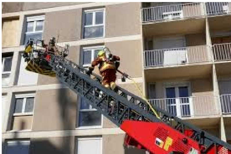
Les sapeurs-pompiers en intervention

Les représentants des sapeurs-pompiers se présentent et indiquent travailler en partenariat avec la ville d'Albi dans le champ de la prévention, dans le cadre du Conseil Local de Sécurité et de Prévention de la Délinquance (CLSPD), présidé par madame le maire.