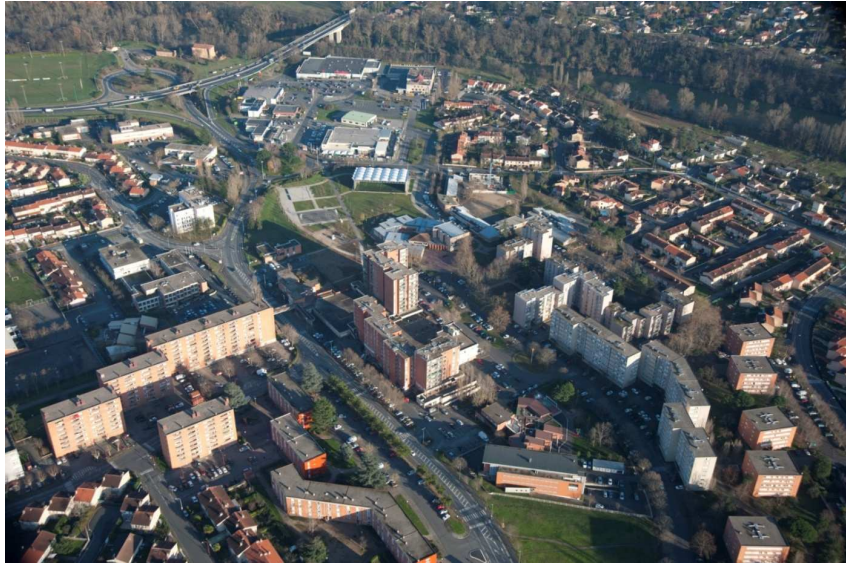
Le quartier vu du ciel

> une étude de recomposition urbaine avec une partie sur l'organisation des équipements et des services publics (agence AUA/T – durée 10 mois): cette étude est la clé de voûte de la réflexion puisqu'elle retranscrit spatialement les besoins identifiés par toutes les études pour redessiner le quartier et garantir un renouvellement urbain en profondeur. Cette étude intègre également la réflexion sur les possibilités de regroupement et de mutualisation entre les services publics de proximité.