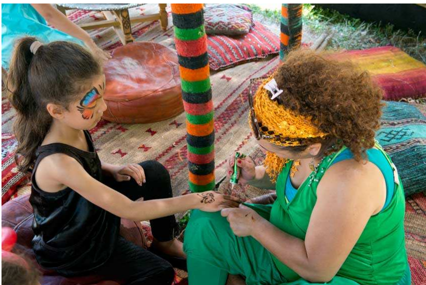
Le Printemps des Cultures (juin 2016) est une action inscrite au contrat de ville de l'Albigeois

L'objectif est d'accompagner la scolarité par des suivis réalisés individuellement par des étudiants qui sont en contact avec les familles. L'ouverture culturelle, l'accès aux loisirs, et l'insertion sociale sont privilégiées par la mise en relation avec les lieux et personnes ressources du quartier.