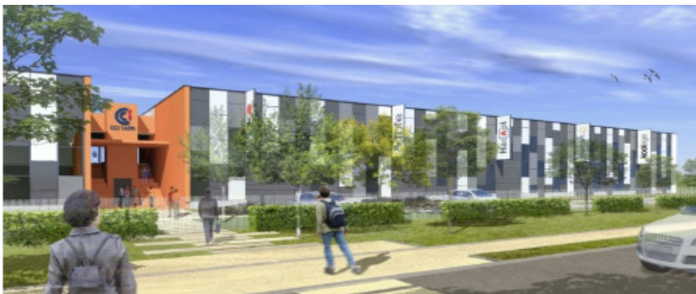
Le futur Hôtel d'activités

D'autres projets se présentent à l'horizon 2016-2017 : un Hôtel d'activités, le pendant de l'Hôtel d'entreprises pour les entreprises d'ingénierie et de production (2300 m 2 d'ateliers et de bureaux).