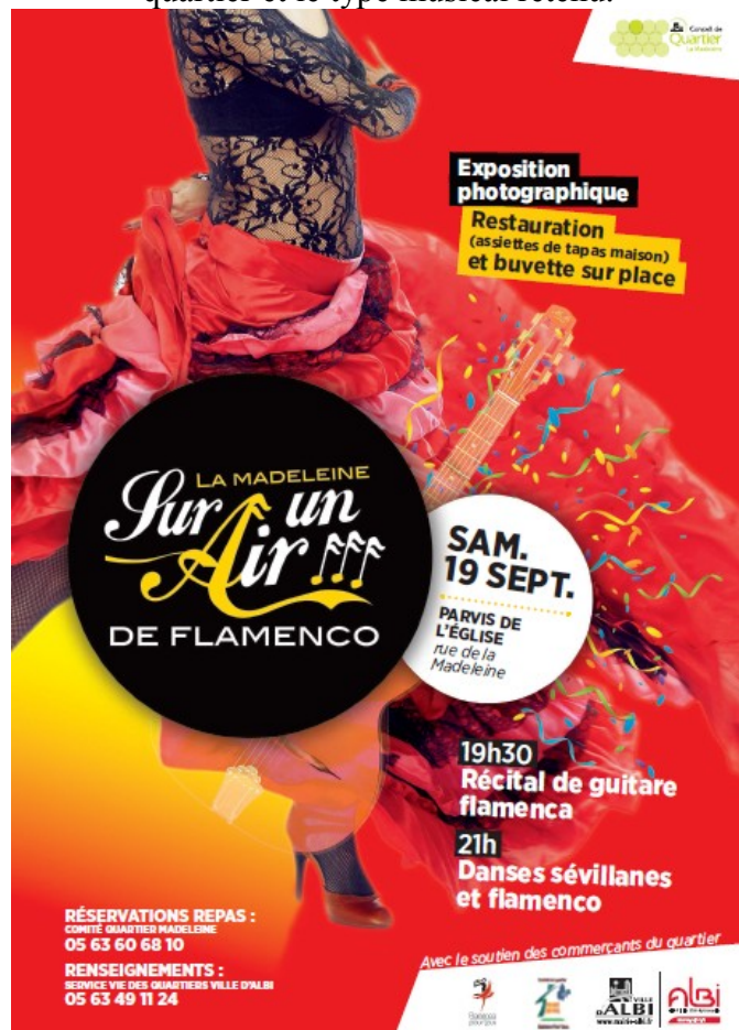
Visuel du flyer de la manifestation «Sur un air de Flamenco » quartier Madeleine 2015

Exemple de déclinaisons du visuel de communication selon le quartier et le type musical retenu.