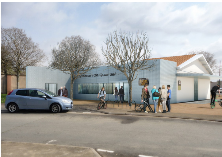
Image de synthèse de la future maison de quartier réhabilitée

Il indique enfin que le budget total alloué à ce chantier est d'environ 500 000 €. Au cours des échanges, les conseillers souhaitent savoir si la maison de quartier pourrait être utilisée pour occuper les jeunes du quartier.