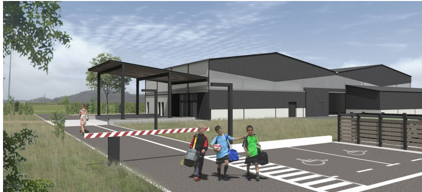
Image de synthèse de la salle de réception et de ses abords

Le chemin d'accès a été élargi et les plantations se poursuivent sur la zone. Enfin, un concierge a été installé sur le site pour pouvoir assurer une présence bienveillante, et organiser plus efficacement le fonctionnement, l'entretien des équipements et pallier rapidement à d'éventuels problèmes.