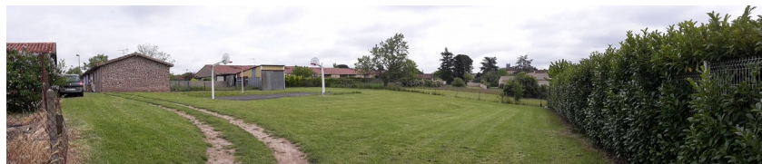
Etat des lieux

Le directeur du pôle Vie des Quartiers – Citoyenneté – Jeunesse propose aux conseillers de continuer à travailler sur le projet d'espace sportif aux Issards dans la continuité des précédentes réunions afin d'affiner le programme des travaux à réaliser. Il rappelle aux conseillers que l'aménagement de cet espace public doit correspondre aux besoins, ne pas être source de nuisances nouvelles et doit rester raisonnable dans le rapport entre l'investissement à consentir et les effets recherchés au bénéfice des habitants de la cité.