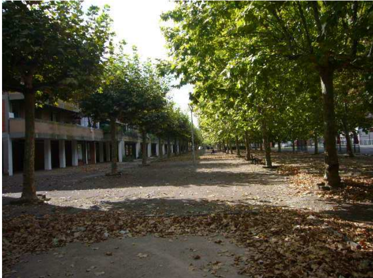
Le mail piéton de Rayssac

Les conseillers sont informés que la Ville d'Albi et Tarn Habitat s'associent autour d'un projet de requalification du mail de Rayssac et de la place Louis Jouvét faisant ainsi suite au programme de réhabilitation des logements mené par Tarn Habitat depuis 2014. Ce projet évalué à 2 million d'euros, serait financé à part égale par la ville et le bailleur. La maîtrise d'ouvrage sera assurée par la Ville d'Albi qui procédera aux aménagements sur les terrains cédés par Tarn Habitat.