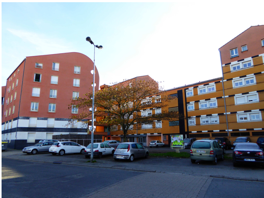
L'avenue Frédéric Mistral – Opération de requalification des abords des immeubles

Il précise aussi que ces aménagements prévoient des terrasses fermées par des palissades et la mise en place de containers enterrés.