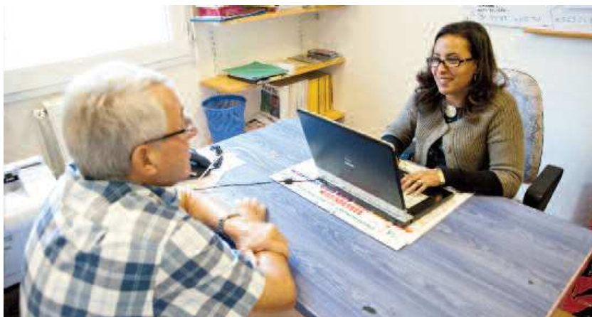
De nouvelles permanences d'accès aux droits dès janvier 2017.

L'action se clôturera le 9 décembre, journée de la laïcité, au Grand Théâtre, avec une exposition et des témoignages.