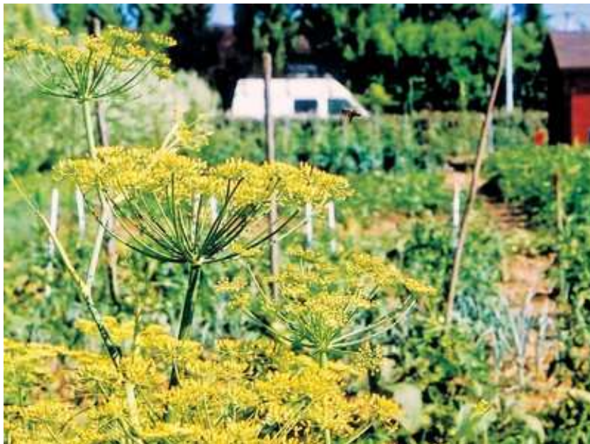
Un jardin en devenir

Le représentant de l'association Sève et Terre, fait également le point sur le déroulement de la nouvelle action « jardin solidaire ». L'association a mené une démarche de prise de contact en « porte-à-porte » dans les logements sociaux de Veyrières-Rayssac afin de présenter son projet et sensibiliser le plus grand nombre d'habitants.