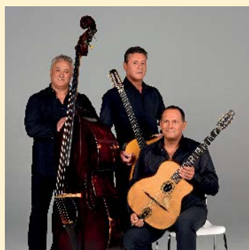
The Stochelo Rosenberg trio