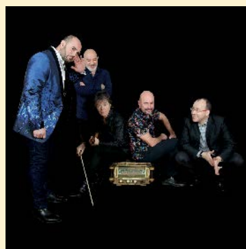
Django AllStars 5tet